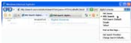
▲ ระบบ Search ค้นหาข้อมูลจากเว็บเสิร์จเอนจินของ IE7 ซึ่งใน IE 6 เองก็สามารถติดตั้งเพิ่มเติมได้เช่นกัน

ดังนั้นหากเรารู้จักปรับแต่งและเพิ่มความสามารถให้กับ IE6 อย่างเต็มที่แล้ว อาทิเช่น การปรับแต่งหน้าต่างและการเพิ่มคุณสมบัติต่างๆ ก็จะทำให้เบราว์เซอร์ที่คุณใช้อยู่มีสภาพใกล้เคียงกับ Internet Explorer 7 มากยิ่งขึ้น ซึ่งคุณสามารถลองใช้คุณสมบัติเหล่านี้ไปหลายๆ จนกว่าเบราว์เซอร์รุ่นใหม่ตัวจริงจะคลอดออกมาให้ใช้จริงๆ โดยที่ไม่จำเป็นต้องติดตั้งเบราว์เซอร์เวอร์ชันทดลองของ IE7 มาใช้โดยไม่จำเป็น ซึ่งคุณอาจจะพบปัญหาในการทำงานบางอย่างอยู่บ้าง เนื่องจากมันยังไม่ใช่เวอร์ชันที่สมบูรณ์แบบ และพร้อมกับการใช้งานจริง