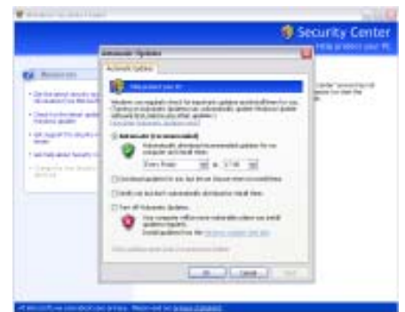
▲ การใช้ Windows Update เพื่อติดตั้ง Service Pack 2 จากนั้นคุณจะได้รับคุณสมบัติรักษาความปลอดภัยใหม่ๆ เป็นจำนวนมาก

เช่นในกรณีที่คุณเจอโฆษณาป๊อปอัพบ่อยๆ มันก็จะลดลง เนื่องจากใน SP2 นั้นจะทำให้ Internet Explorer 6 แยกแยะและป้องกัน โฆษณาป๊อปอัพได้ดีขึ้นนั่นเอง