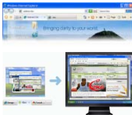
▲ การใช้ Windows Update เพื่อติดตั้ง Service Pack 2 จากนั้นคุณจะได้รับคุณสมบัติรักษาความปลอดภัยใหม่ๆ เป็นจำนวนมาก

ให้ขึ้นตอนการอัปเดตเสร็จสมบูรณ์ ถ้าหาก Internet Explorer กำลังทำงานอยู่ มันจะปิดการทำงานชั่วคราวแล้วเปิดการทำงานขึ้นมาใหม่อีกครั้งหนึ่ง