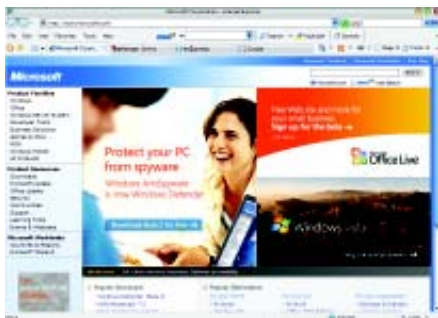
▲ หน้าตาของ Microsoft Internet Explorer 7 เวอร์ชัน Beta 2 ที่สามารถติดตั้งทดลองใช้ได้แล้ว

ส่วนเวอร์ชันที่ใช้ทดสอบหรือที่เรียกว่า เวอร์ชัน Beta นั้นทางไมโครซอฟท์เองก็เริ่มให้ ผู้ใช้บางส่วน ได้ทดลองใช้งานเจ้าเบราว์เซอร์ ตัวใหม่นี้กันบ้างแล้ว แต่ก็ยังไม่ถึงกับแพร่ หลายมากนัก อีกทั้งมันน่าจะยังมีจุดบกพร่อง ในการทำงานอยู่มาก ดังนั้นการเสี่ยงที่จะ เปลี่ยนมาใช้ IE7 สำหรับใครบางคนแล้วดูจะ เป็นเรื่องที่ไม่น่าทำซักเท่าไร ในเมื่อ IE6 ตัวปัจจุบันยังคงใช้งานได้ดีอยู่