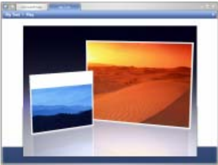
▲ เมื่อคุณกดปุ่ม Play โปรแกรม MicrosoftMax จะแสดงภาพแบบสไลด์โชว์ทันที

หากคุณต้องการแชร์ภาพไปให้เพื่อนๆ ดูบ้าง โดยการส่งผ่านอินเทอร์เน็ตในรูปแบบของอัลบั้มออนไลน์ผ่านโปรแกรม Microsoft Max ให้คุณกดปุ่ม Share จาก List ที่คุณสร้างขึ้นมา จากนั้นทำการกรอกชื่ออีเมลที่ต้องการส่งอัลบั้มภาพของคุณลงในกรอบบนด้านซ้ายมือ ส่วนกรอบด้านล่างคุณสามารถให้คำบรรยายภาพ หรือข้อความที่ต้องการส่งไปหาเพื่อนๆ เกี่ยวกับอัลบั้มภาพที่ส่งไปจากนั้นกดปุ่ม Share this list COM.THAI