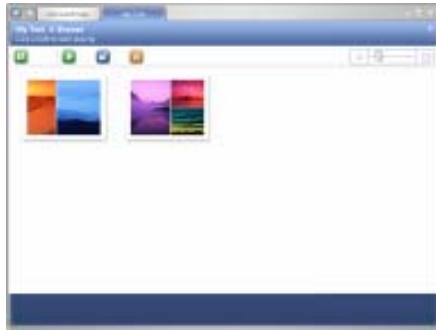
▲ MicrosoftMax สามารถแสดงผลการแสดงผลภาพได้หลายแบบ นอกเหนือจากแบบกรอบภาพ 3D