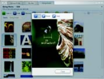
▲ พีเจอร์ Annotate ทำให้คุณสามารถขีดเขียนหรือลบคำบรรยายภาพลงไปในภาพได้อย่างง่าย ๆ